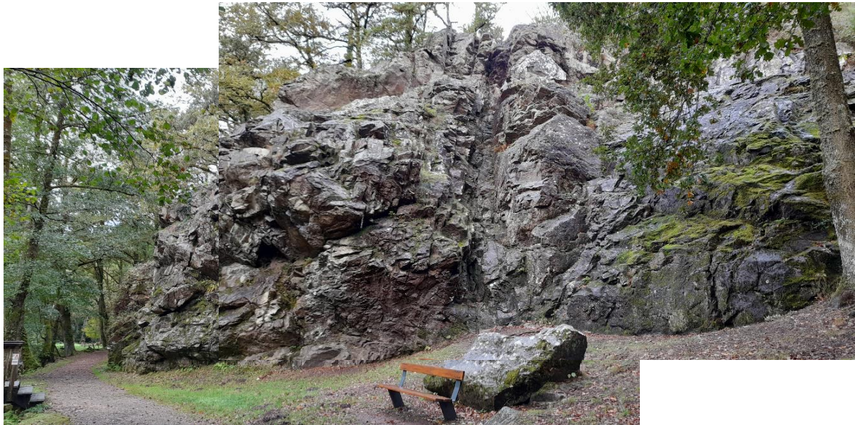
Site d'escalade du Verger