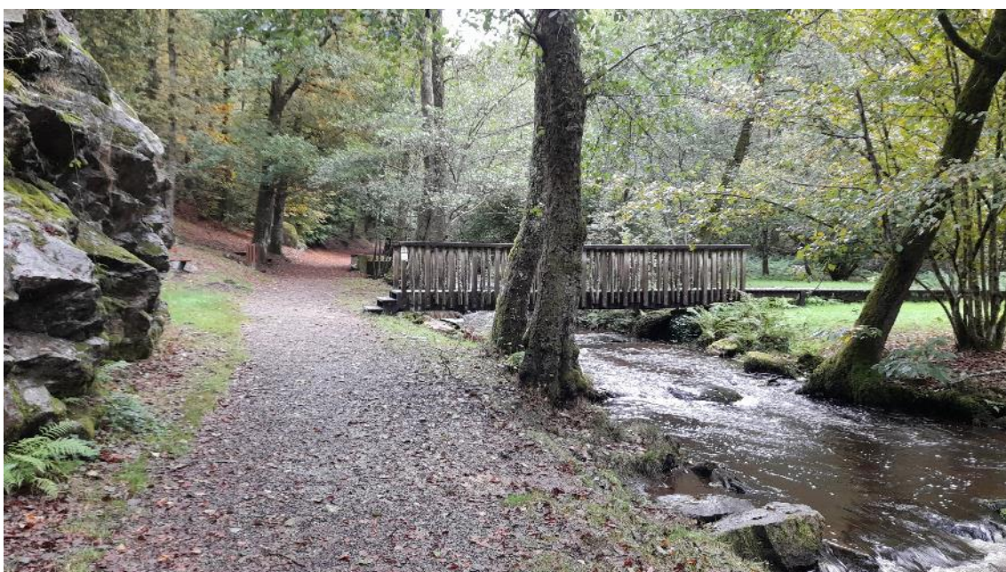
Une vue sur la rivière le Verger et le site d'escalade (à gauche)